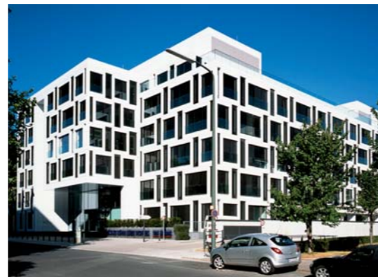
Four Elements, Düsseldorf