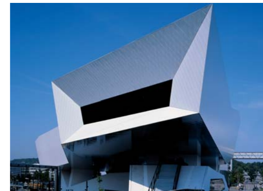
Porsche Museum, Stuttgart