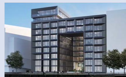
Bauvorhaben am Rödingsmarkt in Hamburg