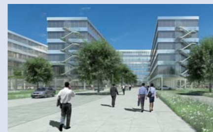
Bauvorhaben HDI Gerling in Hannover

„Fenster-Beschattung und Sichtschutz – da waren Sonderlösungen gefragt“